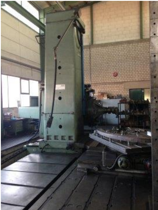
Plattenbohrwerk: bis 13t und 7m Verfahrweg