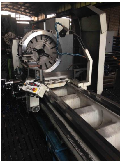
Tus 1000 mit 1000mm Planscheibe