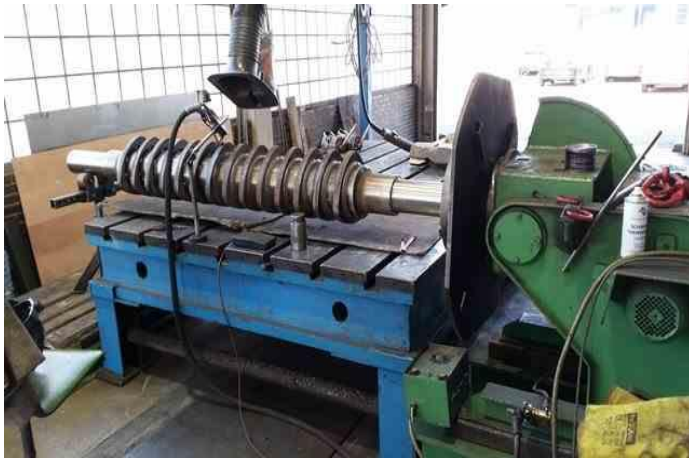
Schweißteil mit Schwenkbarendrehtisch