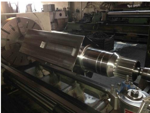
Sui 800 mit 800mm Planscheibe