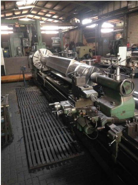
PDR mit 1000mm Planscheibe Ø720 über Support

Wir fertigen Einzelteile sowie Serienprodukte in großen Stückzahlen.