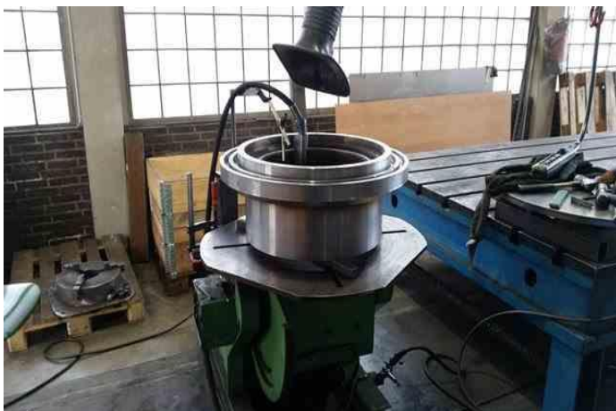
Schweißteil mit Drehtisch

Leiting Zerspanungstechnik ist ein Einschichtbetrieb , der Dank seiner qualitativ hochwertigen und zuverlässigen Arbeit seit 1969 in Bocholt existiert. Mit jahrelanger Arbeitserfahrung garantieren unsere rund 20 Mitarbeiter, dass sämtliche Arbeiten stets optimal und gewissenhaft ausgeführt werden.